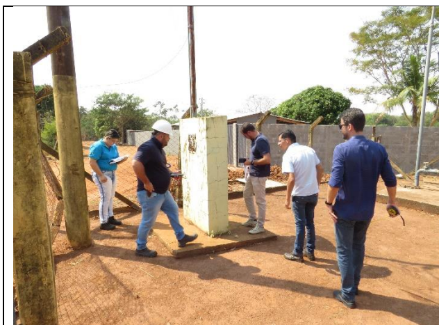
Descrição: Equipes da São Simão Saneamento Ambiental e Novaes Engenharia realizando levantamento em poço.