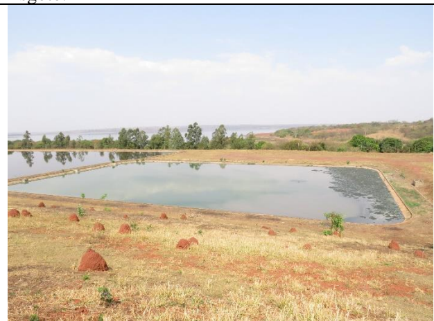
Autor: AMAE Descrição: Lagoa anaeróbia.