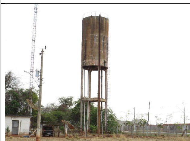
Descrição: Reservatório elevado.