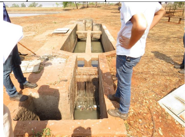
Descrição: Gradeamento da Estação de Tratamento de Esgoto.