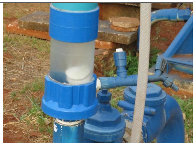
Autor: AMAE Descrição: Sistema de cloração por pastilhas em reservatório.