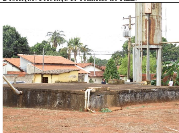
Autor: AMAE Descrição: Reservatório semi-enterrado.