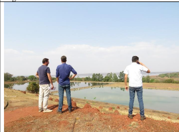
Autor: AMAE Descrição: Lagoas da Estação de Tratamento de Esgoto.