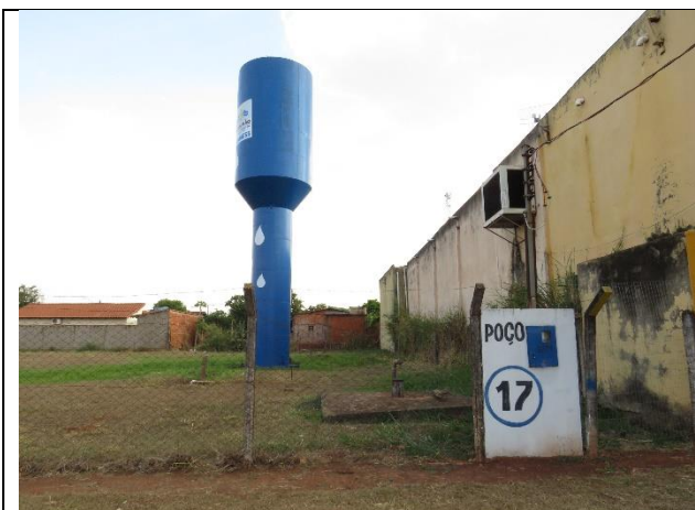
Descrição: Reservatório elevado e poço.