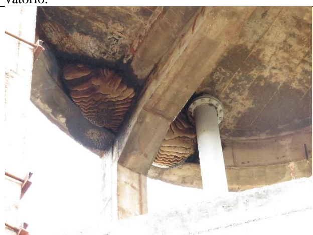
Descrição: Presença de colméias no REL.