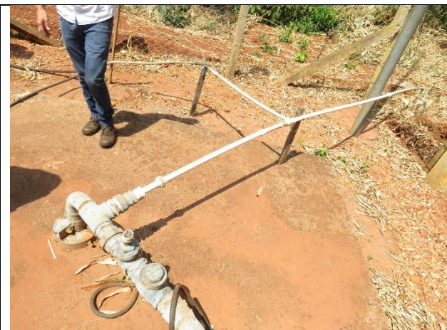
Autor: AMAE Descrição: Poço de água com conexões clandestinas.