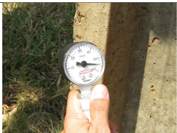
Descrição: Pressão de saída na Estação Elevatória de Água.