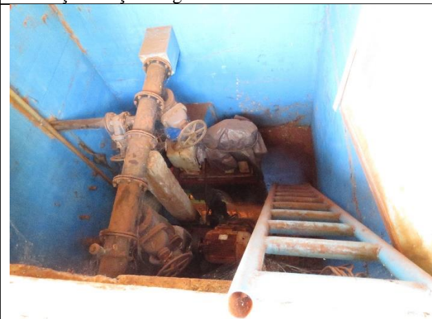
Descrição: Poço de contato da Estação Elevatória de Esgoto.