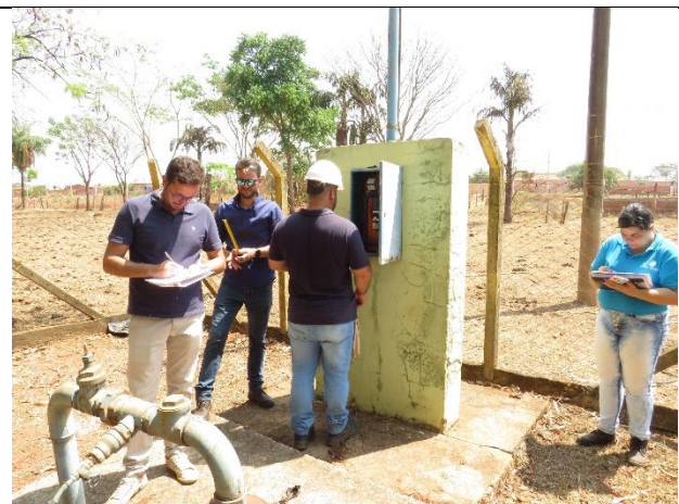
Autor: AMAE Descrição: Levantamento em quadro de comando.